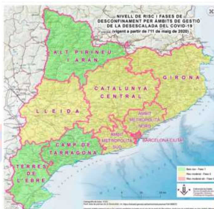
Il·lustració 2 Servei Científicotècnic de Cartografia i SIG de la UdL

Terres de l'Ebre, Camp de Tarragona, Lleida, Alt Pirineu i Aran, Catalunya Central, Girona, Àrea Metropolitana Sud, Àrea Metropolitana Nord, Barcelona ciutat